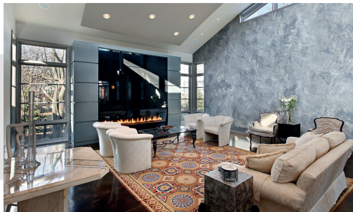
Фото-презентация «Реализованные материалами San Marco проекты»